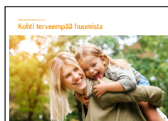
Oriolan vuosikatsaus 2019

Kaikki vuosikertomuksen osiot ovat saatavilla suomeksi ja englanniksi, ja niihin voi tutustua verkkosivuillemme .